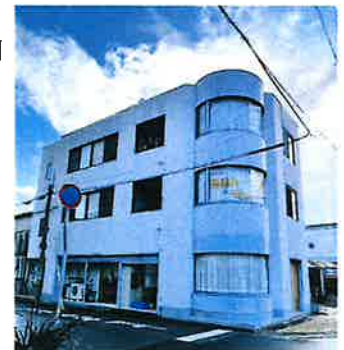
1階にコスモス共同作業所 があります

いつも NPO 法人明石ともしび会にご協力いただき有難うございます。 地域活動支援センターのコスモス共同作業所が3月に同じ樽屋町の 近隣ビルに移転しました。法人の所在地も変更しますので、急遽3月30日 NPO 法人の臨時総会を開いて定款変更を行いました。 以前は3階に事業所がありましたがこのたび1階に移転しましたので、 通所者様の階段の上り降りの必要がなく、荷物の搬入作業の負担も ずいぶん減りました。 新しい環境下でコスモス共同作業所を開所して、新たに通所者様を 募りたいと思います。 今後ともコスモス共同作業所をよろしく願いいたします。