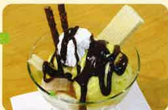
チョコレートサンデー ¥400 和風サンデー ¥400