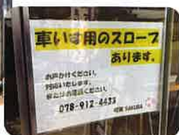
●車イスの方も安心です。