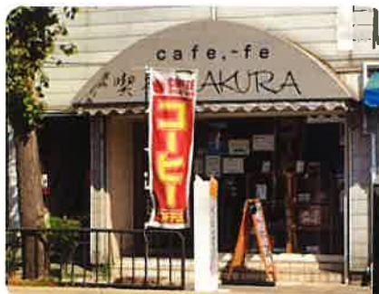
●山陽大蔵谷駅のすぐとなりです!

店内には障がいのある方たちが心をこめて作った手作り小物やクッキーも販売しています。