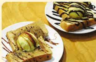
Dセット (チョコソース&バニラアイスのトースト・ドリンク付き) Eセット (黒蜜&バニラアイスのトースト・ドリンク付き) 各¥500