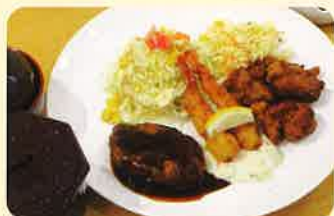
ハンバーグ&エビフライ&鶏の唐揚げセット ¥800