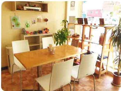
●楽しくふれあえる明るい店内。

ます。 昨年からおードブル(ご予約1週間前まで)やランチBOX(ご予約3日前まで)も始めました。 ランチ会もできますので是非ご相談ください。 また店内にてギャラリー展を開催することも出来ます。(無料です。今までパステル画、障がいをもった方のえんぴつ画、絵画などの展示をしています。)