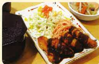
チキンカツセット ¥580