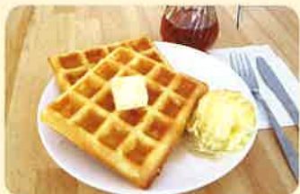
ワッフルセット ¥600 (バニラアイス添え・ドリンク付)